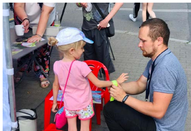
Na stoisku PEC Sp. z o.o. na najmłodszych czekało wiele atrakcji.

Dni Bytomia odbyły się w dniach 24-26 czerwca. Bytomianie podczas pierwszego dnia mogli posłuchać twórczości artystów z Ukra-