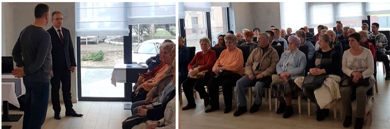
Spotkanie z mieszkańcami dzielnicy Łągiewniki

PEC Sp. z o.o. planuje na lata 2018-2019 realizację inwestycji „Wdrażanie programu ograniczania niskiej emisji przez PEC Bytom – ucieplnienie zabudowy wielorodzinnej” w Bytomiu – Łągiewnikach.