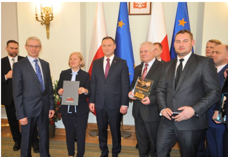
Pamiątkowe zdjęcie delegacji PEC Sp. z o.o. z Prezydentem RP

Przedsięwzięciu przyświeca idea promowania wśród pracodawców dobrych praktyk współpracy i na-