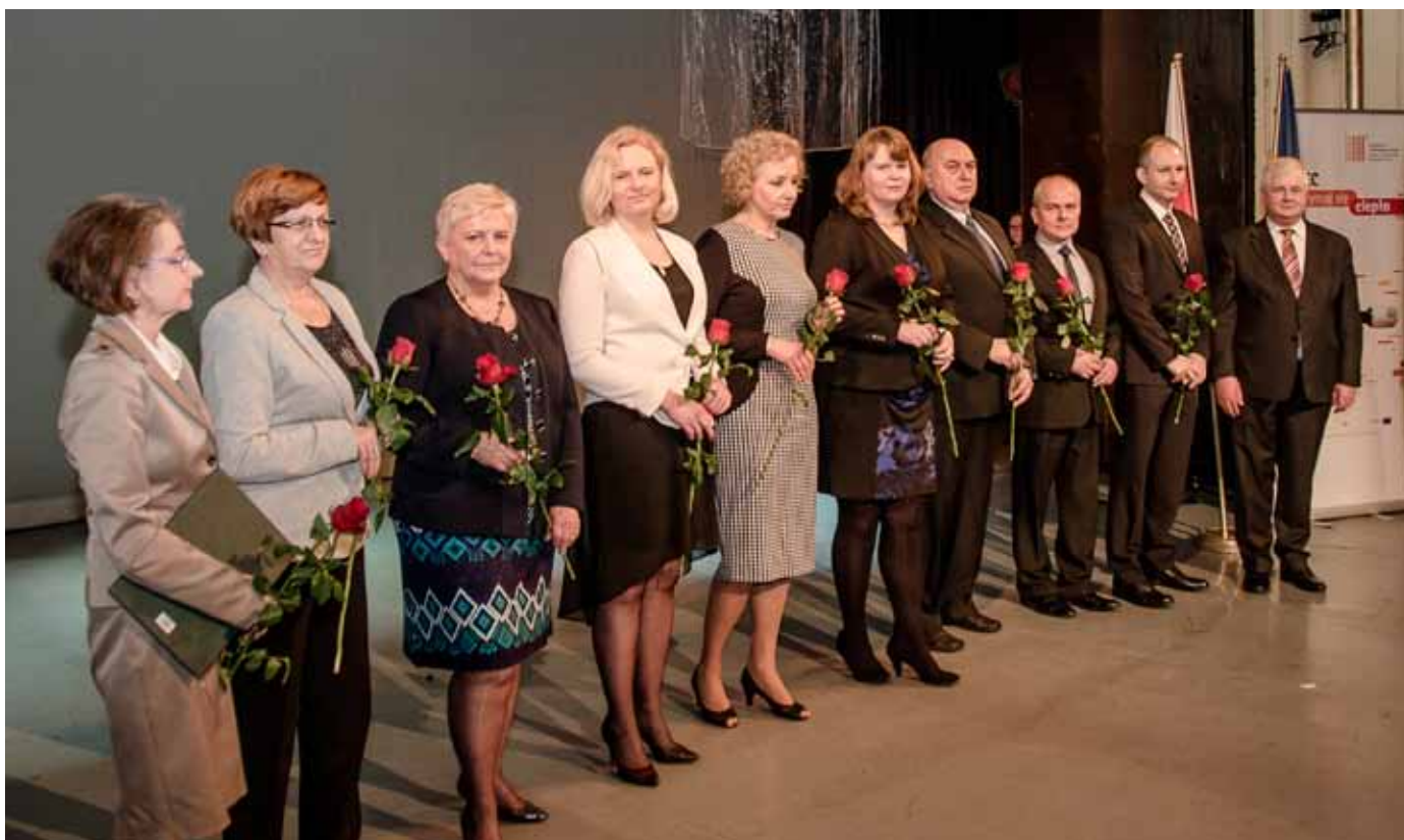
Zespół realizujący projekt Funduszu Spójności.

15 stycznia 2015 roku w przepięknych wnętrzach Opery Śląskiej w Bytomiu odbyła się konferencja podsumowująca cztery lata realizacji przez Spółkę projektu inwestycyjnego „Modernizacja gospodarki ciepłej dla gmin: Bytom i Radzionków”.